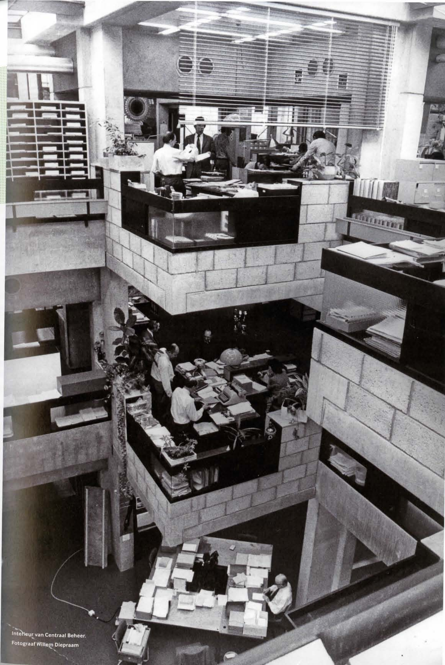
Interieur van Centraal Beheer.

Opdrachtgever Centraal Beheer, Apeldoorn Architect Herman Hertzberger, Amsterdam Adviseur constructie D3BN, Dicke & v.d. Boogaard Aannemer Ballast Nedam Programma kantoorgebouw Ontwerp 1967-1972 Realisatie 1977-1979