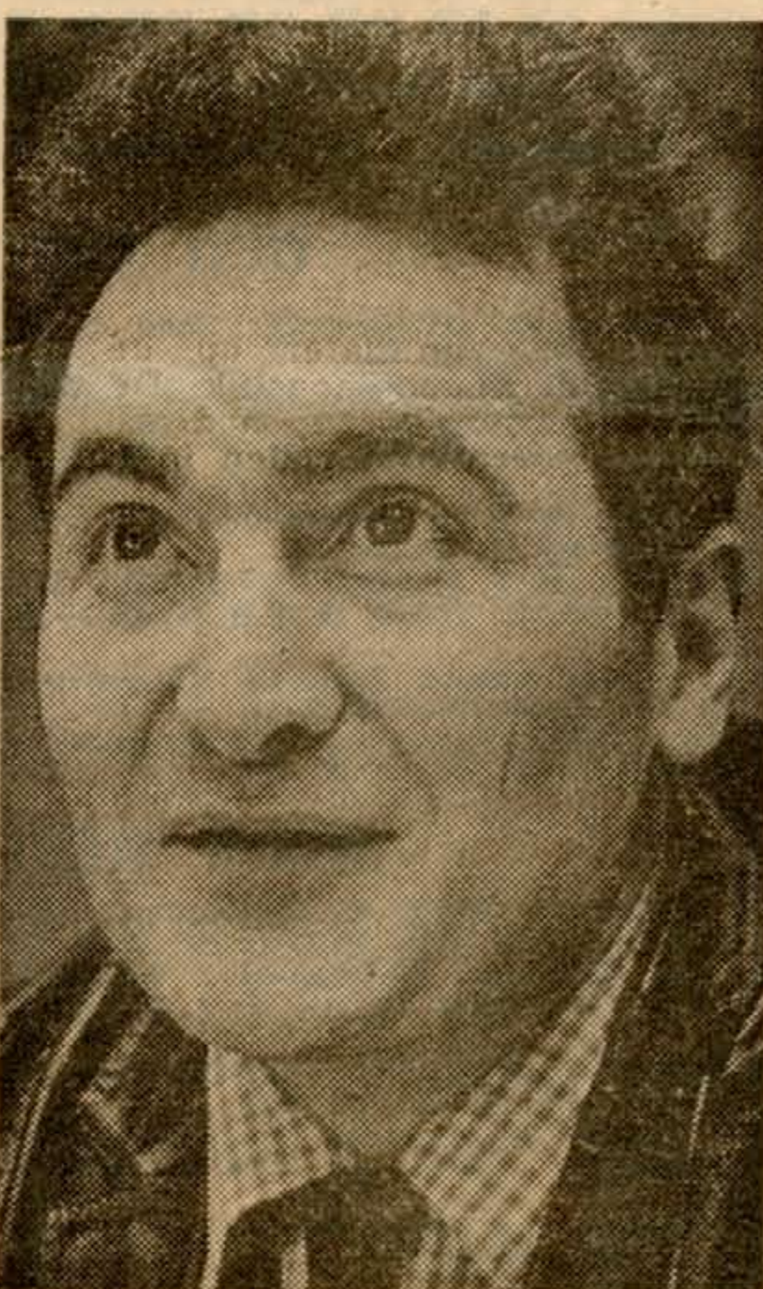
HERMAN HERTZBERGER ...architectuurprijs...

Het betere leven dat hij zichzelf en zijn medemensen wenst bestaat niet „in een dikke buik en een nog grotere auto”, maar in meer vrijheid en meer contact. Het is het evangelie van een optimist, die een hoge dunk heeft van zijn medemensen. Het is ook het evangelie van sterke, sobere naturen, die van „ruig” houden. Hertzberger is eigenzinnig maar niet on sociaal.